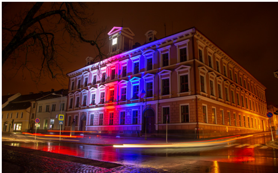
Takové byly oslavy 28. 10. v Novém Městě na Moravě. Více na straně 6.