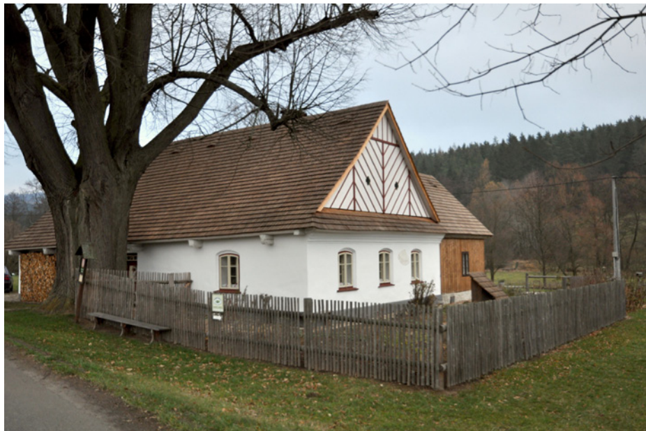
Chalupa pod lípou v Krásném patří ke skvostům zdejší lidové architektury.

nebo česat. Dobytku se musela nanosit voda den dopředu. Brzy ráno, ve vzdálenějších vsích už třeba ve tři ráno, se vstávalo na mši. Věřilo se, že pokud na Hod boží svítí slunce, bude obilí drahé. K jídlu měl sníst každý alespoň lžičku hrachu, aby se urodilo. Dívky také bedlivě sledovaly, na kterou stranu běží pes, kterého ráno vypustily ze dvora – věřily, že z té strany jim přijde ženich. Horáci také věřili, že následujících 12 dní představuje 12 měsíců nadcházejícího roku. Bedlivě si tedy zapisovali, jaké je každý den počasí, aby byli dobře připraveni na příští rok.