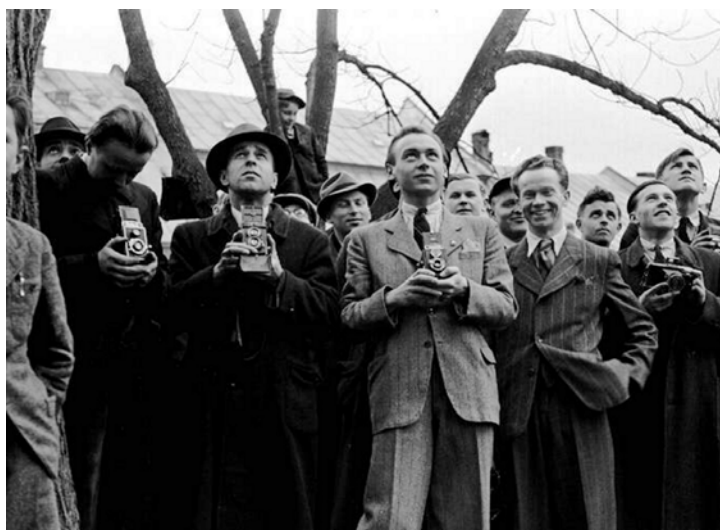
Poznáte některého z fotografů, kteří se shromáždili před katolickým kostelem při snímání zvonů z věže v dubnu 1942?