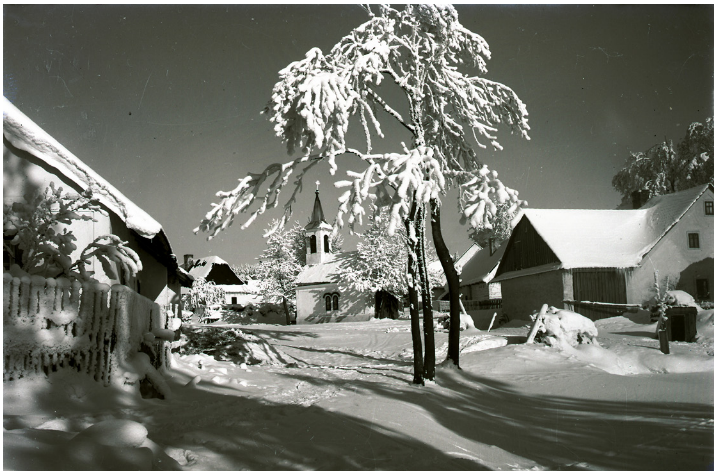
Zima ve Studnicích

Překvapilo mě také množství starých černobílých fotografií. Ale nešlo jen o osobní snímky ze života profesora Podlouckého. Prostřednictvím fotografií se snažil o dokumentární zachycení obyčejného života na Horácku v první polovině minulého století. Proto mají jeho snímky velkou