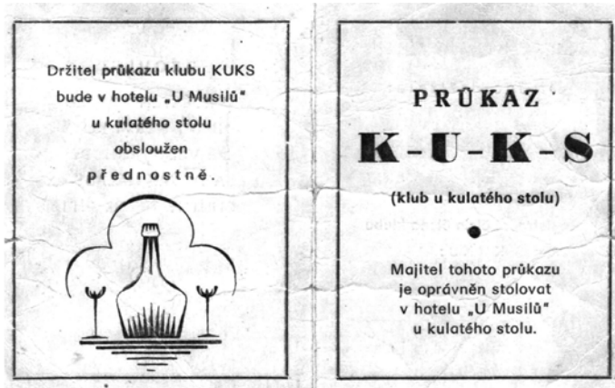
Členský průkaz klubu u kulatého stolu