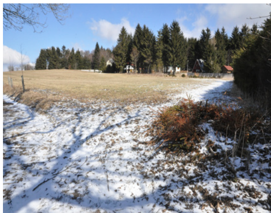
Sporná lokalita na Studnicích.

Diskuzi vzbudily také plánované změny v loka-