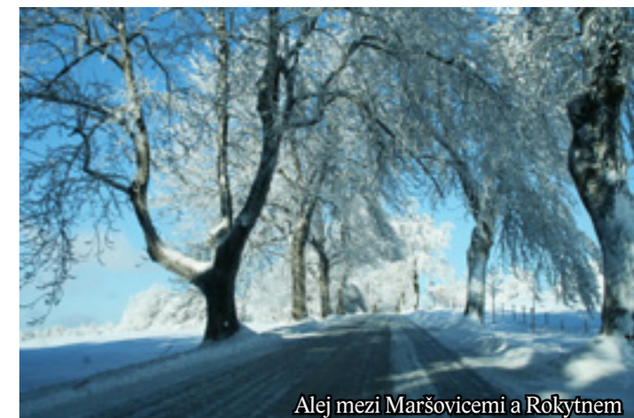
Alej mezi Maršovickými a Rokytnem