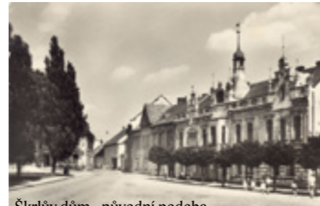
Škrlov dům - původní podoba