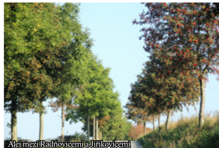
Alej mezi Radňovicemi a Jiřkovicemi

alej především díky jeřábům. Jasně červené jeřabiny, symbol zdejšího kraje, jsou jako korálky zářící v ranním slunci. Kdysi bývaly jeřáby téměř u každé cesty, dnes je jich jen poskrovnu. Přesto na Vysočinu vždy patřily a stále patří. Svůj hlas můžete těmto alejím dát na internetových stránkách http://www.alejroku.cz/ . -hzk-