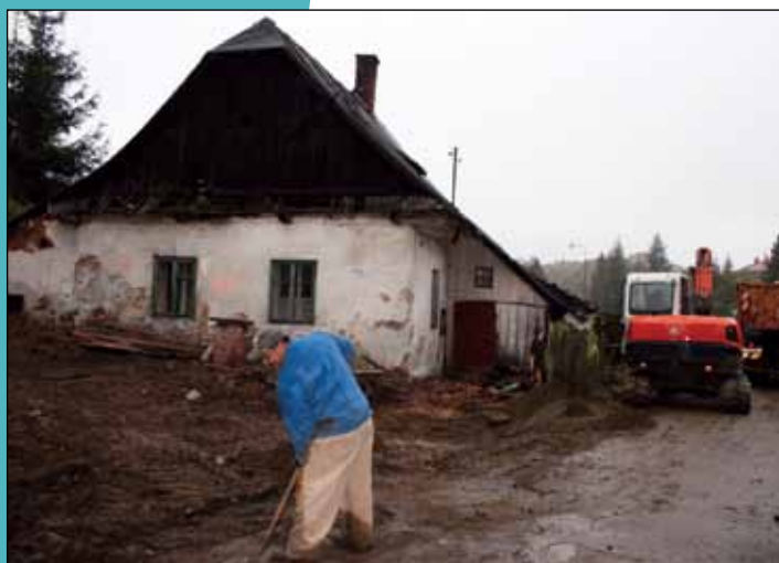
Bourání staré ruiny na ulici Malá