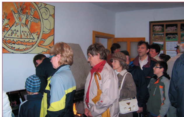
Nahoře: Mezinárodní den seniorů oslavili pohledectí seniori dne 3. října společně s pohledeckým Českým svazem žen. Více na str. 3. Druhá řada: Na Rytířských bramborových slavnostech hrála 10. října velkou roli fantazie. Jak v pohádkovém představení „skutečných“ rytířů, tak v dětském vymyšleném zajímavých postavíček z brambor. Více na str. 2. Třetí řada vlevo: Šupinovka kostrbatá - důkaz, že patří opravdu k nejkrásnějším podzimním houbám. K textu na str. 6. vpravo a dole: Dne 10. října bylo plno jak uvnitř chaty Mercedes, tak před podiem u ní.