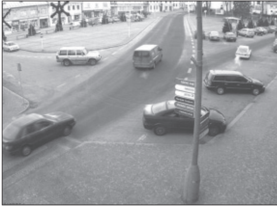
KAMEROVÝ BOD Č. 2 Vratislavovo náměstí č.p. 12 poliklinika směr 1. základní škola