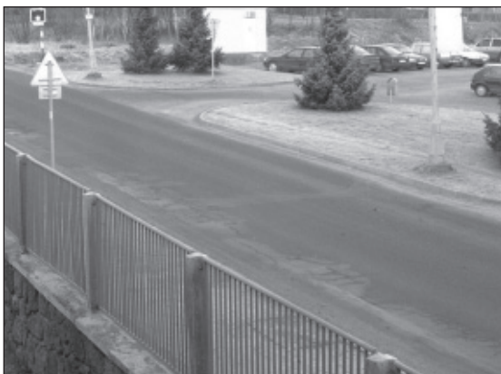
KAMEROVÝ BOD Č. 5 Žďárská č.p. 610 výjezd z města Žďár, Tři studně