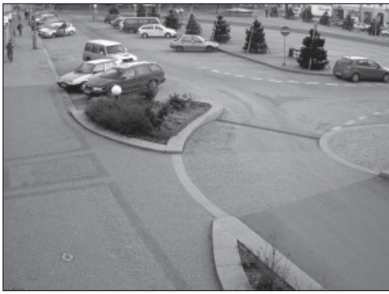
KAMEROVÝ BOD Č. 1 Vratislavovo náměstí č.p. 103 Městský úřad směr Hor. galerie