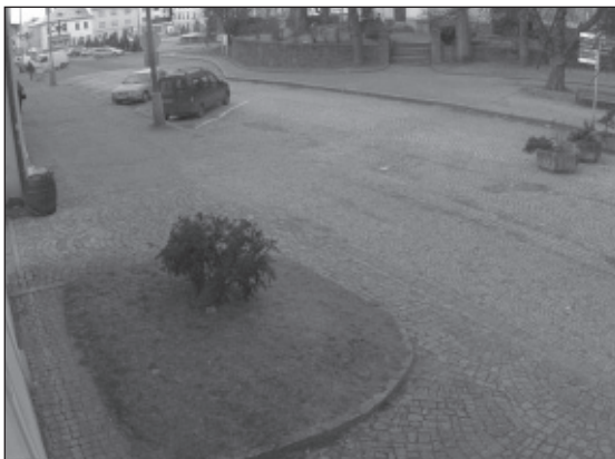
KAMEROVÝ BOD Č. 3 Vratislavovo náměstí č.p. 1 Hor. galerie směr Městský úřad