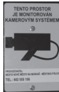
KAMEROVÝ BOD Č. 6 Vratislavovo náměstí č.p. 12 hlavní vstup do budovy polikliniky

Jak doplnila starostka města Zdeňka Marková, jsou opatření proti zneužití velmi přísná, bezdůvodný vstup do archivu snímků je vyloučen a dokonce byla vhodným způsobem upravena i místnost s kamerou - sledovací stanoviště, a to pro případ, aby záznam nemohly sledovat nepovolené osoby.