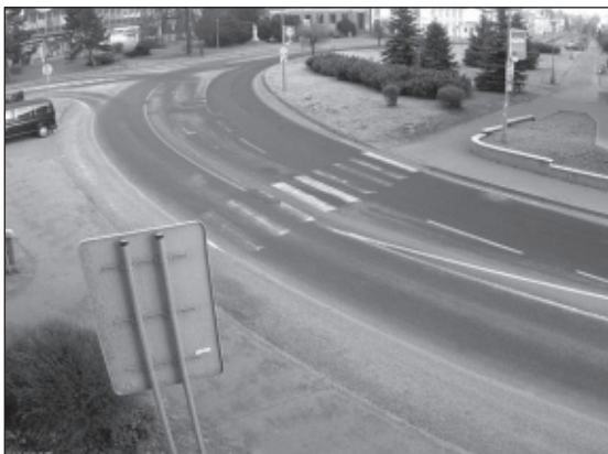
KAMEROVÝ BOD Č. 4 Komenského náměstí galerie směr Masarykova ulice