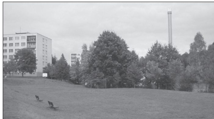
Pozemky na ul. Budovatelů, o které má Orel zájem.

ní sportoviště s možností využití veřejností a investované z větší části z peněz mimo rozpočet města. Návrh komise ZM, který měl naši podporu, nebyl schválen. Následně byl paní starostkou předložen stejný návrh RM, který ZM na jednání 17. 6. 2008 odmítlo, tj. odkup s nízkými cenami pozemků areálu kina a bez jejich náhrady, a byl schválen 12 hlasy.