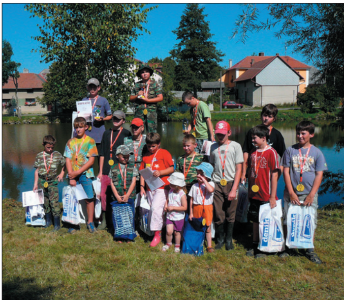
Mladí rybáři z Hlinného. K textu na str. 7.

NOVOMĚSTSKO - vydává město Nové Město na Moravě. Redaktorka: PhDr. Eva Jašková, redakce a administrace: Vratislavovo nám. 103, 592 31 Nové Město na Moravě, telefon 566 650 253, 724 984 857, e-mail: zpravodaj@nmmn.cz http://noviny.nmmn.cz. Tiskne Horácká tiskárna Nové Město na Moravě. Registrační značka OÚ 3714-1491. Nevyžádané rukopisy a fotografie se nevracejí. Názory autorů příspěvků nejsou vždy totožné s názory redakce.