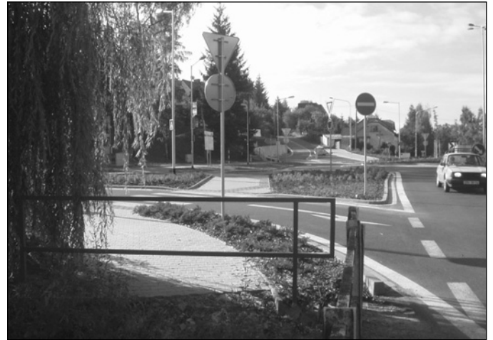
Na podzimní měsíce jsou plánovány některé stavební investice – parkoviště na Drobňého ulici a lávka pro pěší přes potok Bezděčku u kruhového objezdu.

Jak uvedla starostka Zdeňka Marková, konečná prodejní cena bude nižší než tržní a na její výši se budou muset politicky dohodnout místní volební strany. EJ