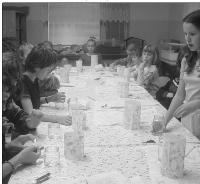
kroužek Netradiční výtvarné techniky