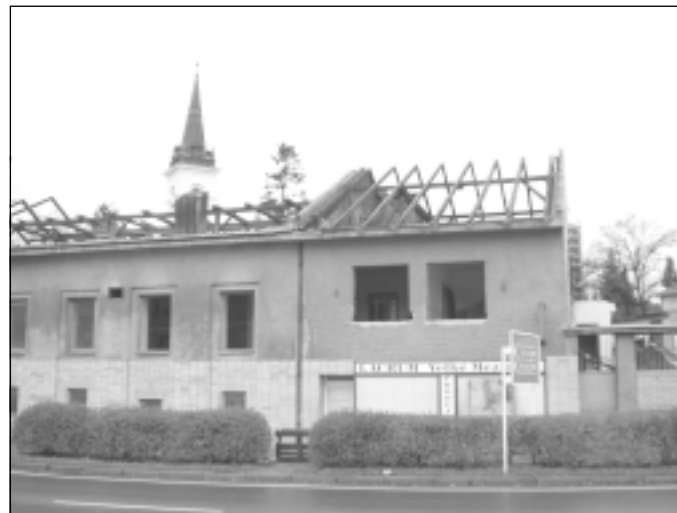
Areal novoměstské mlékárny se bourá. Uvolní se tak plocha pro výstavbu nové prodejny Diskont Plus a přilehlého parkoviště pro vozy zákazníků. V prodejně by mělo najít zaměstnání asi 20 osob.