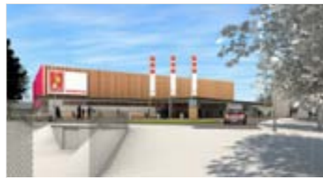
Vizualizace sportovní haly - jihozápadní pohled

Objekty ankety, ve které se rozhodovalo, zda se dříve postaví bazén či sportovní hala, nejsou jedinými sportovními stavbami, o kterých se mluví ve spojitosti s Novým Městem. Letos by měl ve městě vyrůst zásobník sněhu, vypsána byla již veřejná zakázka na tuto stavbu. Zásobník sněhu zajistí dostatek sněhu i na začátku zimy,