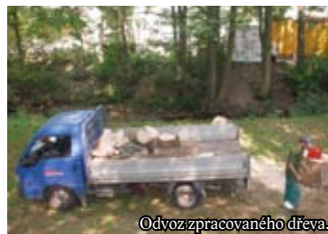
Odvoz zpracovaného dřeva.