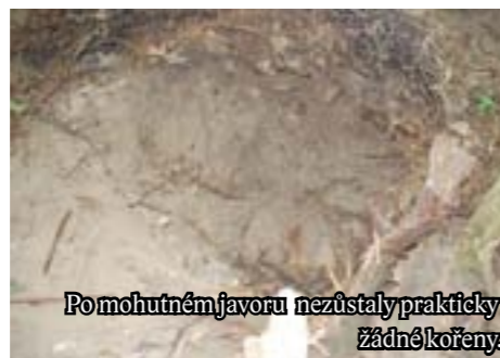
Po mohutném javoru nezůstaly prakticky žádné kořeny.