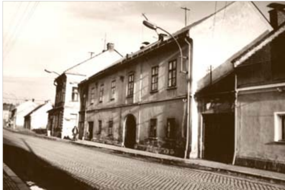
Dům U Majorů, napravo býval sklad sboru dobrovolných hasičů. První hasičská zbrojnice bývala na dvoře radnice (dnes I. ZŠ). V roce 1935 byla postavena nová zbrojnice, která slouží dodnes.

Citováno z: Jaroslav Kříčka, Nové Město na Moravě v letech 1892 a dalších, Nové Město na Moravě 1909.