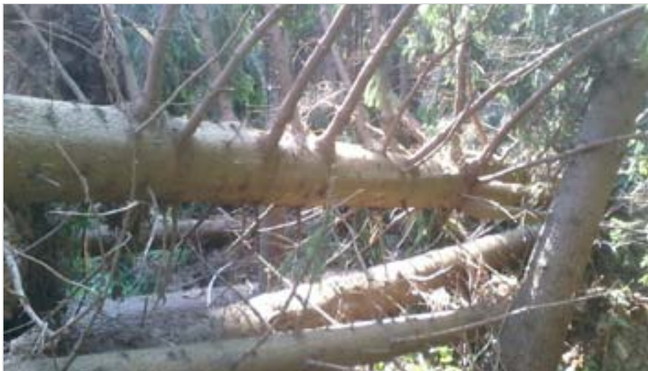
Dne 12. 8. postihla městské lesy větrná bouře, která způsobila vývraty a zlomy v celkové výši cca 80 až 100 m 3 dřeva.