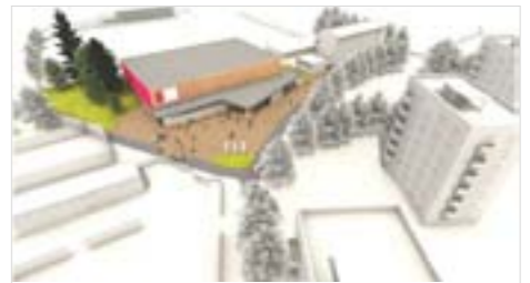
Vizualizace sportovní haly - pohled od ul. Tyršova

Objekty ankety, ve které se rozhodovalo, zda se dříve postaví bazén či sportovní hala, nejsou jedinými sportovními stavbami, o kterých se mluví ve spojitosti s Novým Městem. Letos by měl ve městě vyrůst zásobník sněhu, vypsána byla již veřejná zakázka na tuto stavbu. Zásobník sněhu zajistí dostatek sněhu i na začátku zimy,