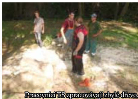
Pracovníci TS zpracovávají zbylé dřevo.