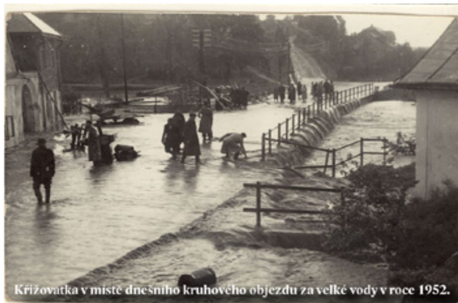
Křižovatka v místě dnešního kruhového objezdu za velké vody v roce 1952.

domů u potoka. Nastala velká spoušť. V domech plaval nábytek, zvířata a všude byly nánosy bahna. Děti fascinovala ukrutná síla vody, která unášela například kovová kamna a jiné masivní věci. Lidé říkali, že jednomu starému člověku uplavala kufr s penězi a že se chtěl všet. Ta prudká voda byla pro město předzvěstí budoucích změn. Pak přišla peněžní měna a staré pořádky byly přetřeny. Vše mělo dále postupovat jednotně vědecky, bez názorového vybočení z řady. Náboženství bylo nevědecké a jen okrajově trpěné. Uběhlo pár let a přišlo další znamení v podobě ničivé smrti. Příleťla ze směru od Černého rybníka a přeletěla nad Pasáčkem, čili nad horním okrajem Nečasovy ulice. Větrný vír smrštil odnesl střechní domku stojícího vedle kapličky. Smršť se hnala dál a nad domkem vyrvala i s kořeny dvě mohutné lípy. Za nimi v aleji lámala a vytrhávala mocné stromy až k Panskému (Kaštánkovu) dvoru. Jako kdyby v jámách vytržených stromů ukázala novou cestu obživy od matky země. I svým letem větru dala zprávu o rychlém příchodu nových lidí do města. A opravdu pak nastal rozvoj uranového dolování a s ním příchod nových obyvatel. Následovaly zásadní změny ve vývoji města. Nečasova ulice, skrze kterou živly promluvily, se stala hektickou. Snadto mávosudu, když dala městu významnější lidí. Jiří Hubáček